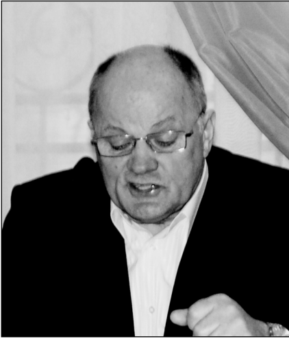
РЕСНТ ОЛЕКСАНДР ПЕТРОВИЧ, член-кореспондент НАН України, заступник директора Інституту історії НАН України, голова правління Спілки краєзнавців України