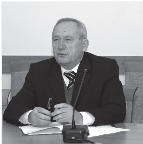
Рогожа Михайло Миколайович, начальник відділу гуманітарної освіти та національного виховання департаменту вищої освіти Міністерства освіти і науки України