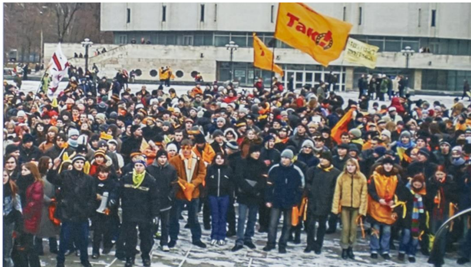
Фото. Студенти і викладачі КПІ під час Помаранчевої революції.

Дівчинка, що вчиться в одному класі з моїм братом, придбала собі нову помаранчеву кофтинку. Вона не належала до якоїсь партії і тим більше не мала на увазі чогось, що пов'язане з ситуацією в нашій країні. Але наш завуч по виховній роботі, побачивши це, буквально напала на ту дівчину і почала ображати її при всіх учнях». [3, с.143]