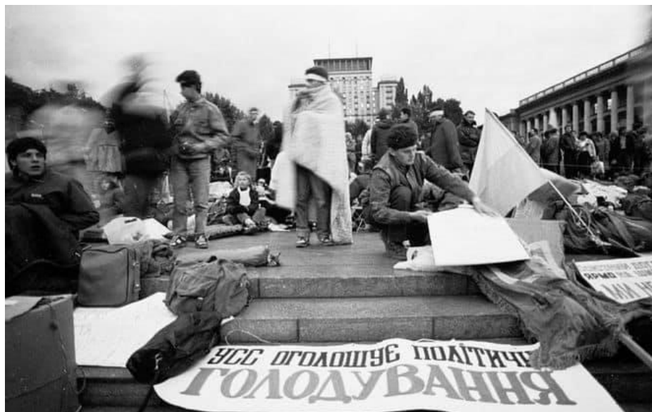
Фото. Голодування студентів під час Революції на граніті.

приєдналася народна артистка України Ніла Крюкова, приходила Ліна Костенко. Кілька народних депутатів на підтримку студентів також оголосили голодування просто в сесійній залі. Олесь Гончар після того, як комуністична частина Верховної Ради відмовилася підтримати студентів, демонстративно поклав свій партійний квиток [3].