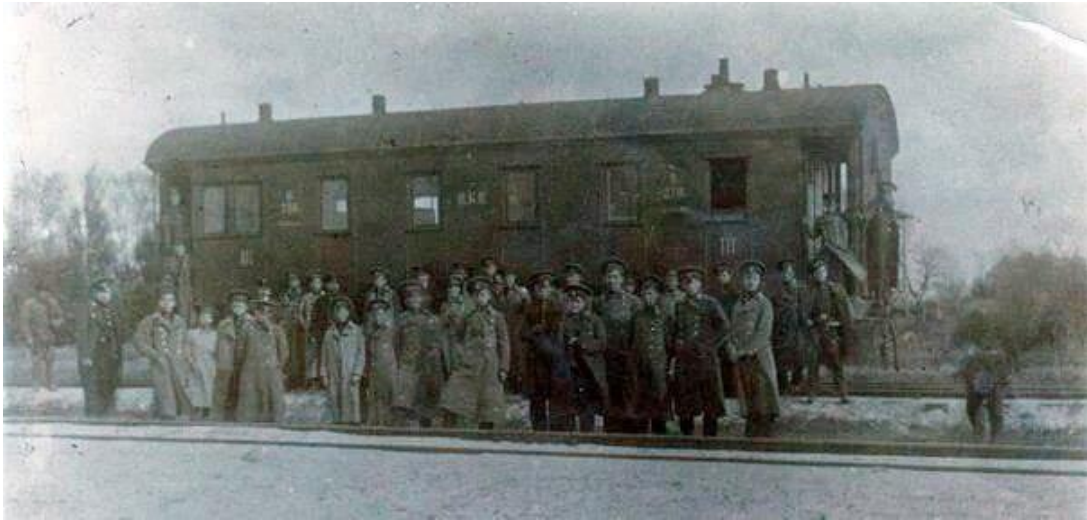
Фото. Студенти на станції Крути до бою.