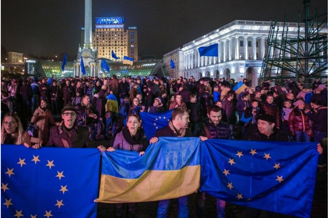
Фото. Учасники Революції Гідності.

Революція почалася як мирні протести проти відмови українського уряду підписати Угоду про асоціацію з Європейським Союзом. Протестувальники, переважно молодь, зібралися на Майдані Незалежності в Києві, виражаючи своє незадоволення корупцією, авторитарним режимом та недотриманням прав людини.